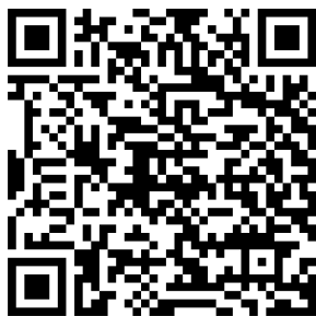
QR-kod Googleplay för Android

Börja med att ladda ned appen "QT kund" från Google play för androida telefoner eller App store för apple. QR-koder till respektive leverantör finns nedan. Vill man hellre använda webbsida går det att göra via 3089.qtkund.se eller QR-koden nedan.